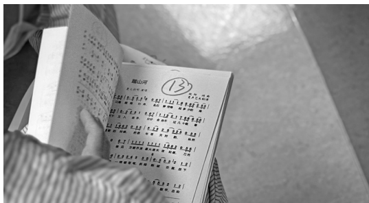
患者自己挑选歌谱

相比于儿童，青少年患儿反而更难适应重症病房的生活。他们会上网主动了解病情，清楚自己可能要面对的艰难，随之而来的压力和烦恼也更大。针对这类孩子，音乐治疗会侧重帮助他们接纳自己，找到控制感以积极应对病情。